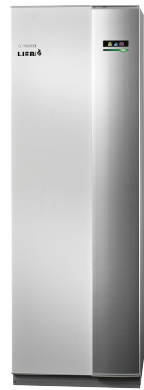
NIBE F 1345